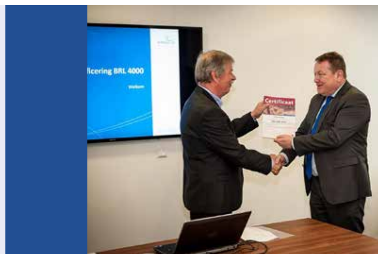
De feestelijke uitreiking van het eerste certificaat archeologie

Wie archeologisch onderzoek op het land of onder water wil uitvoeren heeft hier sinds de Erfgoedwet van kracht werd een certificaat voor nodig. Tot die tijd bestond er een vergunningstelsel, waarbij het Rijk aan archeologische bedrijven of diensten een opgravingsvergunning verleende. De belangrijkste reden om over te gaan op certificering was de wens om niet alleen bij het verlenen van de vergunning aandacht te besteden aan de kwaliteit van archeologisch onderzoek, maar voortdurend. Organisaties die professioneel opgraven kunnen nu bij verschillende certificerende instellingen een certificaat aanvragen. Door de archeologische sector is binnen het Centraal College van Deskundigen (CCvD) Archeologie de kwaliteitsnorm als basis voor de certificering opgesteld.