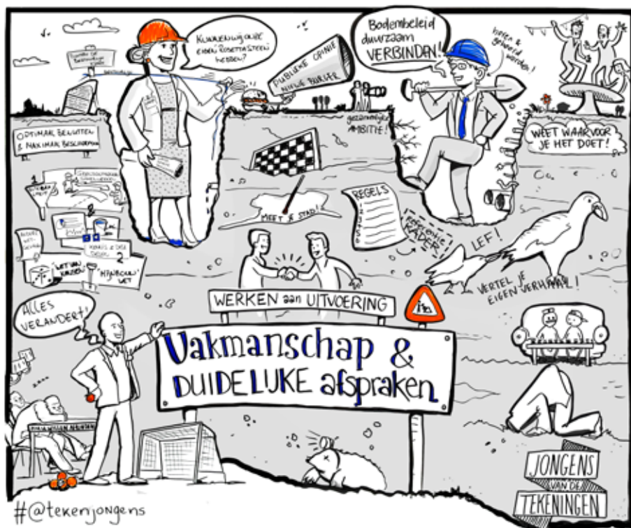
De 'Tekeningens en meisjes' actief op het SIKB congres, 2015