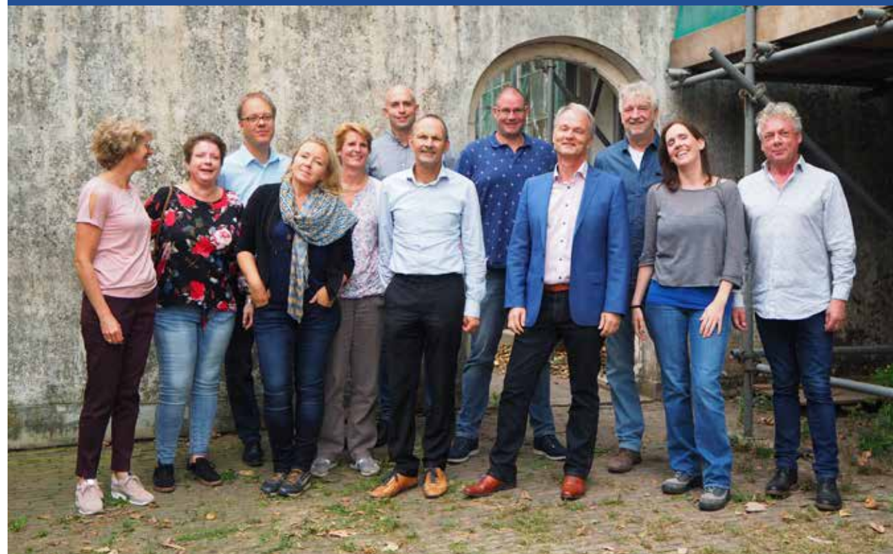
Het SIKB team anno 2018