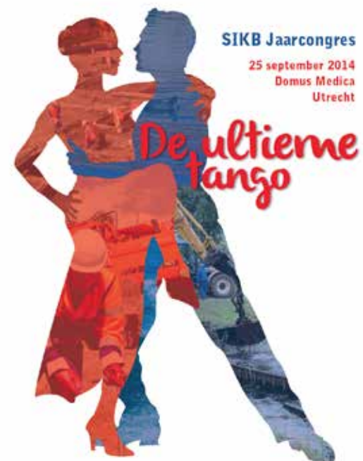
De tango op het SIKB jaarcongres, 2014